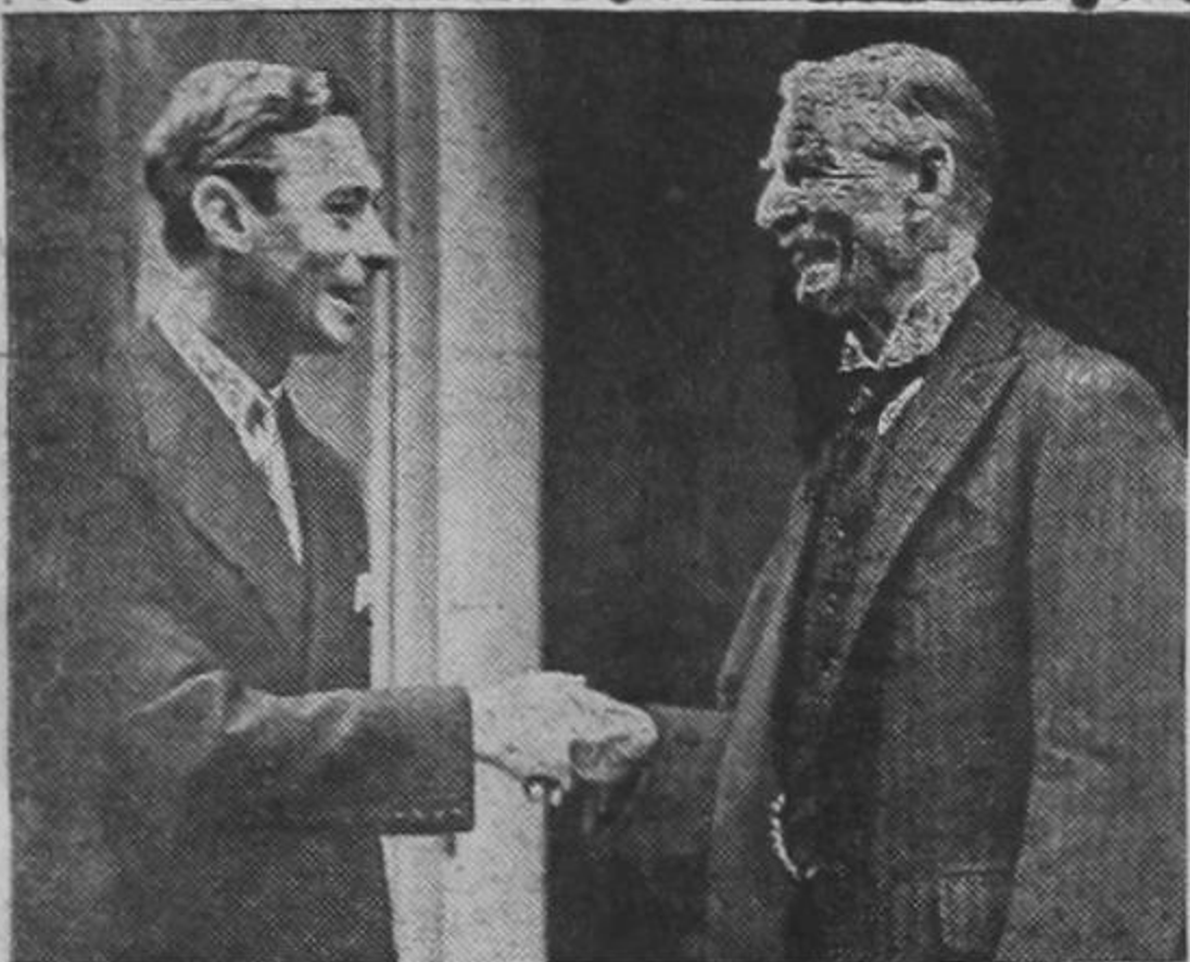
El Rey Jorge VI estrechando la diestra del Primer Ministro Neville Chamberlain. La foto fue hecha momentos después de que el Premier había concluido de exponer, recientemente, a Su Majestad Británica la marcha de la guerra.

Material de guerra y aeroplanos es lo que requiere Finlandia para proseguir su defensa