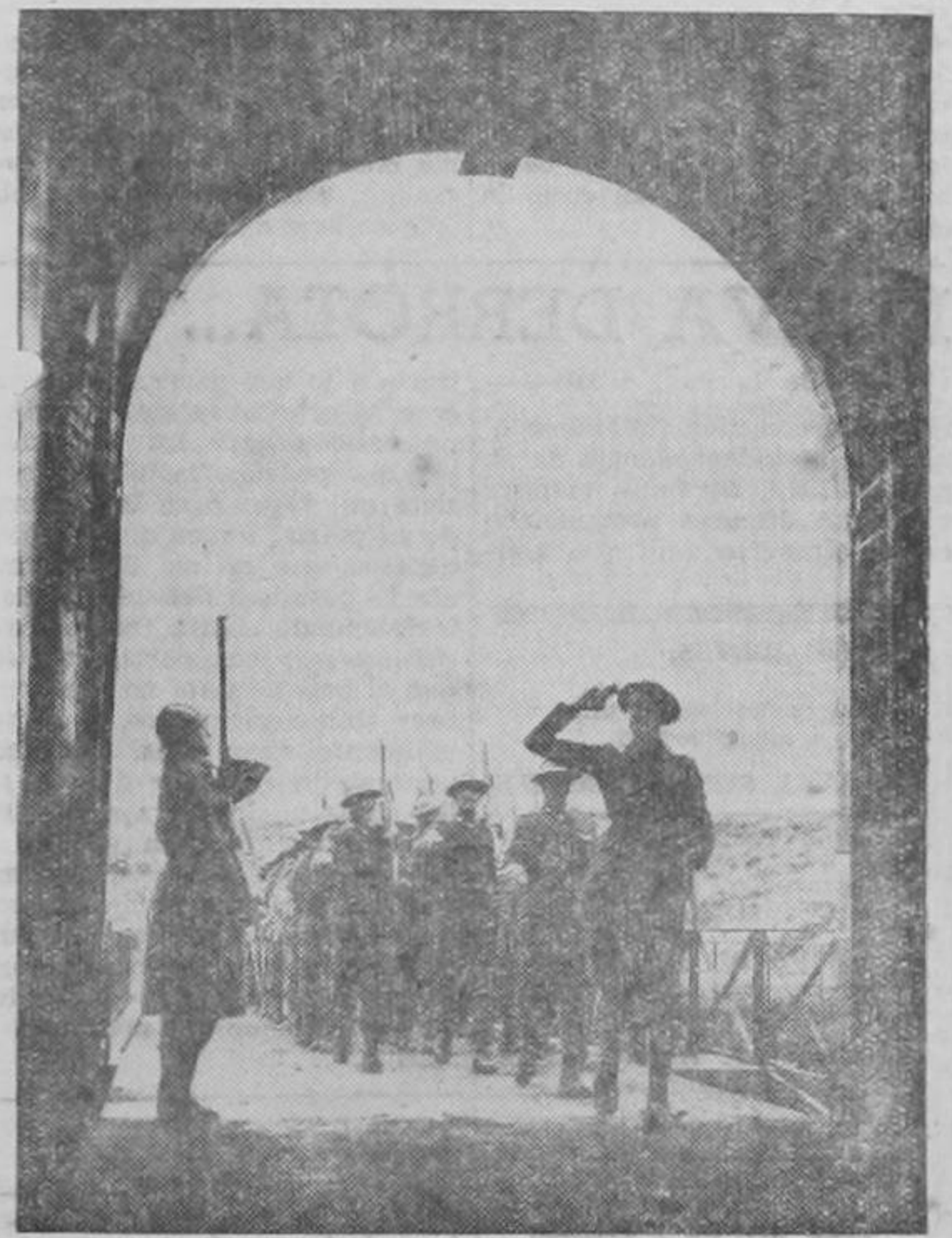
Camaradas de armas. — Tropas británicas y francesas desfilan hacia el Frente Occidental. El guardia francés presenta armas al destacamento de tropas británicas.

Louis hubiera podido tirar a Dempsey de la manera que lo tiró Firpo y, antes que el argentino, Gunboat Smith al mulato se le hubiera "aclarado el color" en cuanto a Dempsey y lo golpeará, de la misma manera que se le aclaró fren-